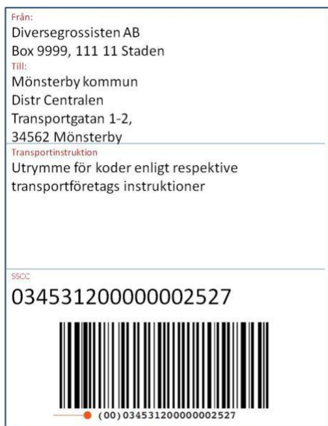
Figur 3 Exempel Sändningsetikett