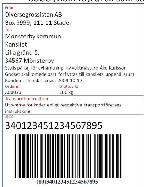
Figur 2: Exempel kollietikett